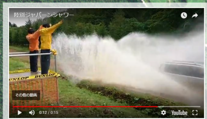
陸別ジャパーンシャワー

循環バスは、7:30a.m.から運行します。 A・B・C・Dエリアに行くための降車場所は バス停②に集約いたします。